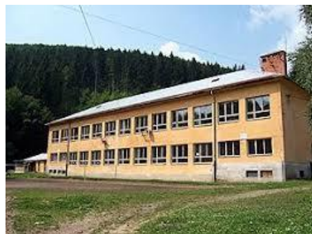
Základná škola s materskou školou Utekáč

Teším sa zase na stretnutie so svojimi učiteľmi.