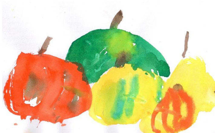
Vašík Kasperlik, 1. tř.: Podzimní zátiší

Nedočkávané ručičky už zase šmátraly po svačince, takže se mléčný automat zasekl. Pítíčko zůstalo zašprajcováno ve výtahu, a než přijel pan montér automat spravit, celá škola málem zemřela hladem a žízní.