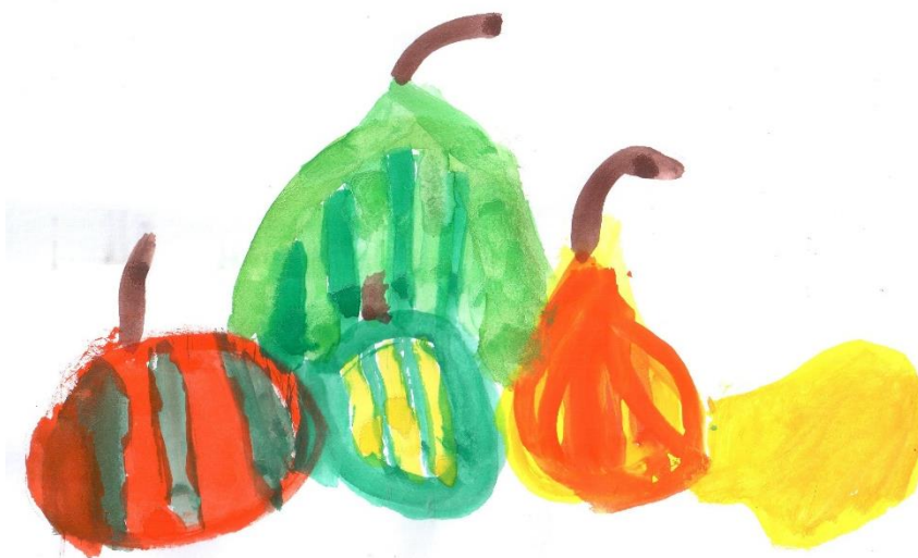
Míša Vlachová, 1.tř.: Podzimní zátiší

„Proč ses nepodíval pod ten svetr?“ kárala nepořádníka. „Ten přece není můj!“ ohradil se Š.