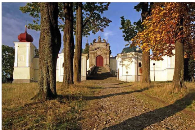
Poslední zastávka – panorama v Orlických horách