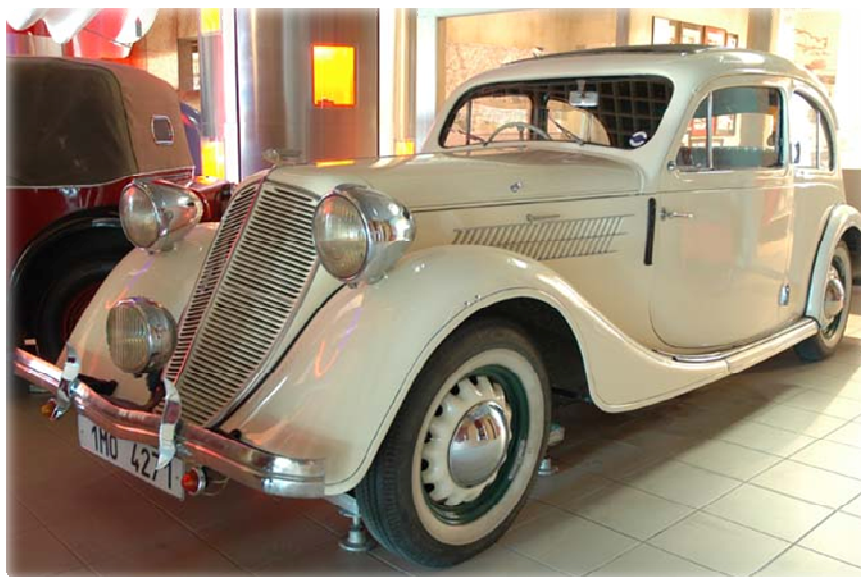
Super muzejní kus