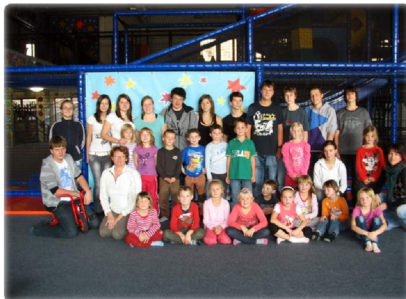
Naše partička v Galaxii ve Zlíně

Práce s prvňáčky byla super. Bude se nám s nimi těžce loučit, ale do života jim přejeme hodně štěstí.