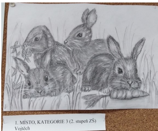
1. MÍSTO, KATEGORIE 3 (2. stupeň ZŠ) Vojtěch