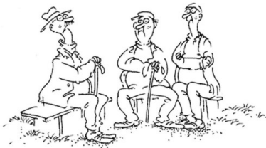
MĚL JSEM NEVESELE DĚTSTVÍ, ČASO ANI NA PŘÍPOJENÍ K INTERNETU NEBYLO.

Na Mikuláše oslavil Vladimír Renčín , kreslíř, ilustrátor a humorista 75 let .